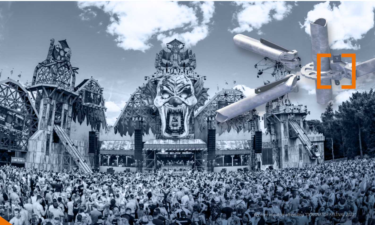
Rechten van deze afbeelding "DOMINATOR FESTIVAL 2022"